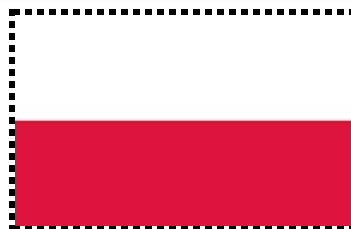
Naše československá vlajka