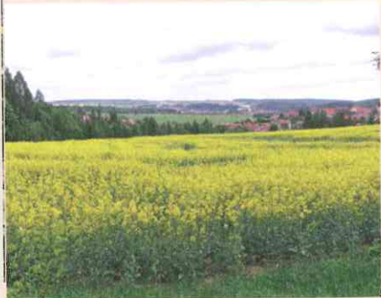
Řepka olejka na Dražanské vrchovině